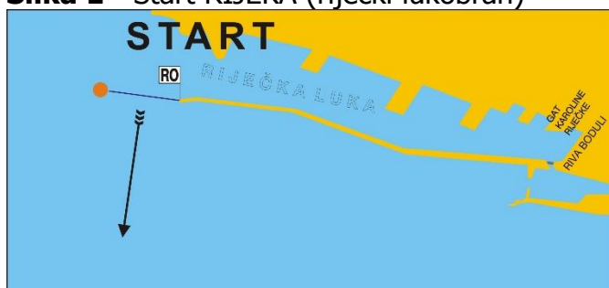
Slika 1 - Start RIJEKA (riječki lukobran)